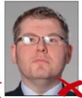
Flash reflection on glasses