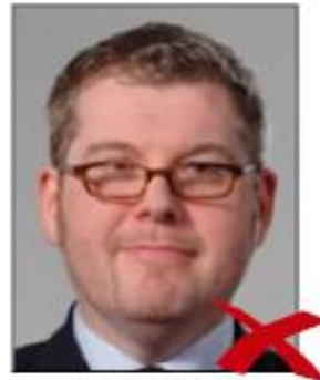
Frames covering eyes

Η άκρη των φακών ή των πλαισίων δεν πρέπει να καλύπτει κανένα μέρος των ματιών.