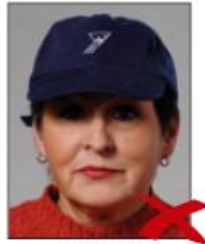
Wearing a hat

Όπου επιτρέπεται η επικάλυψη κεφαλής, το πρόσωπο πρέπει να είναι ορατό από το κάτω μέρος του πηγουνιού μέχρι και το μέτωπο.