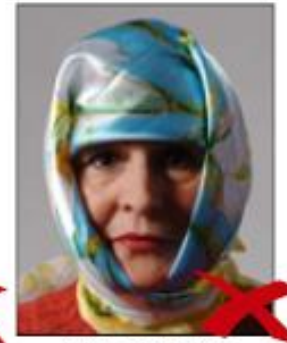
Shadows across face