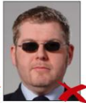
Dark tinted glasses